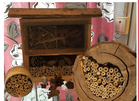
Biholkar tillverkade av studiecirkeln

en nybakad kaka. Någon tittar till den picklade rödlöken som lyser starkt rosa i sin burk. I kväll blir det fest med rosa tema. Till det rosa potatismoset med lax serveras naturligtvis rosévin och därefter blir det musikunderhållning, kaffe och rödbetskaka. Klädsel: valfri, med minst en rosa detalj.