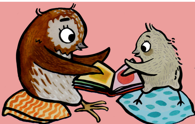
Illustratör: Matilda Ruta

Personal på förskolorna kommer att få fortbildning inom olika teman som stimulerar språkutveckling.