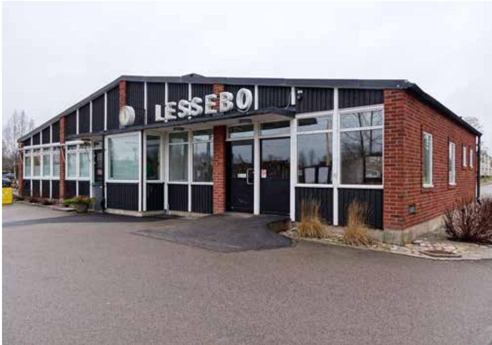
Bild Lessebo stationsbyggnad i trä och tegel, invigd 1957.

ONSDAG 10:E NOVEMBER 2021 RAPPORTEN OM ZANDRA AHL'S "ARTIST IN RESIDENCY" I LESSEBO KOMMUN