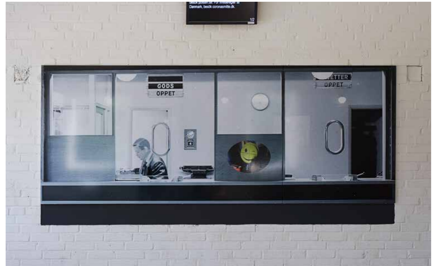
Bild Dekalen med en av Sören Mörchs första smileys monteras i juni, 2021.