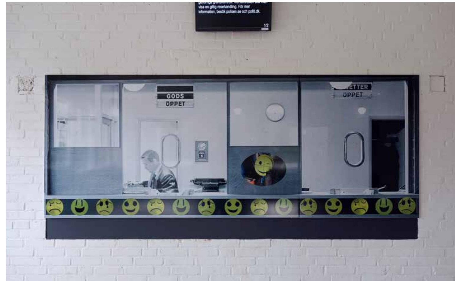
Bild Dekaler med smiley-skyttor skapade av Bikupans högstadiel elever monteras i september, 2021.