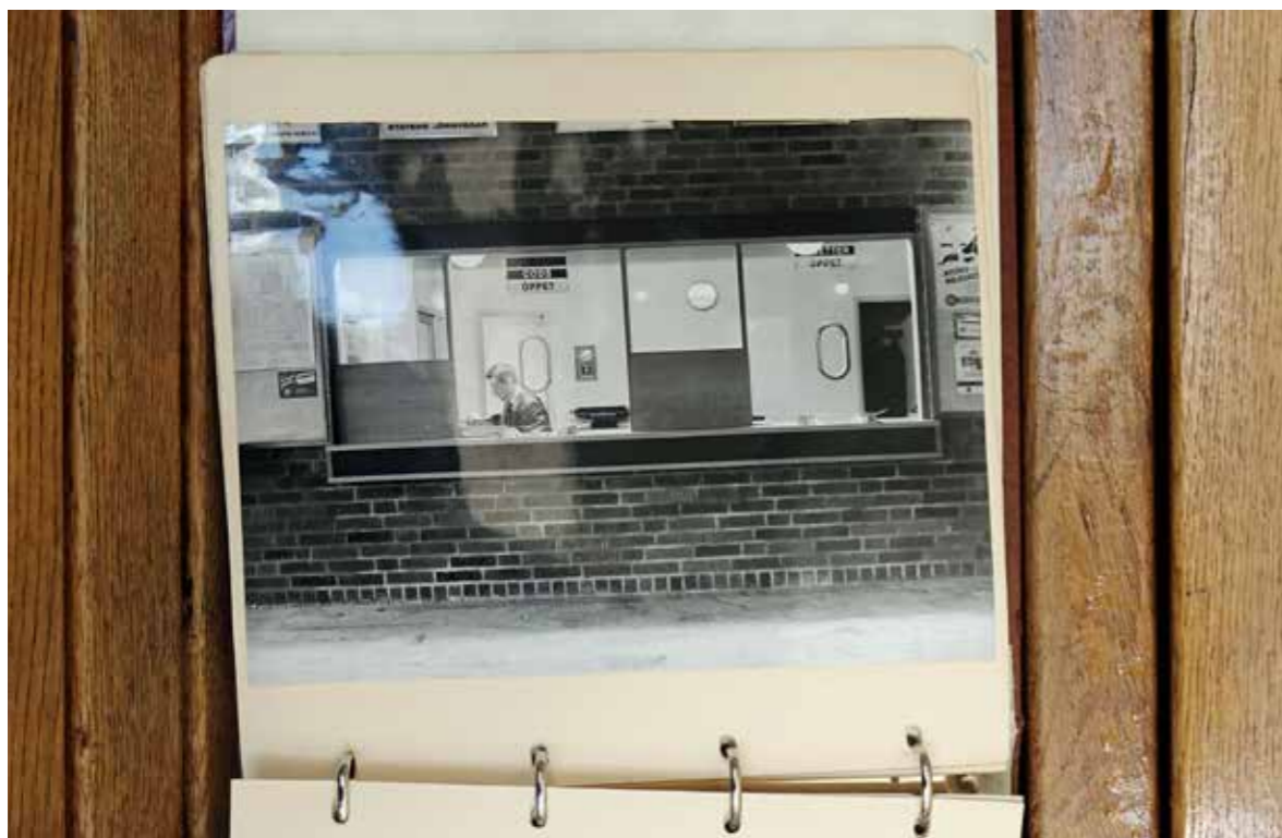
Bild Foto på biljettluckan från 1960-talet som blev utgångspunkt för den Kulturhistoriska samtidstavlan. Fotograf okänd. Foto: Zandra Ahl, 2021

Lessebo station är en vacker och lite sliten byggnad som påminner om en villa. Utanför syns en trappa som leder till ett grönt icke-plats, men jag vet att det en gång låg ett hus där. För det syns på gamla foton jag hittat, huset speglas i ett fönster på en bild.