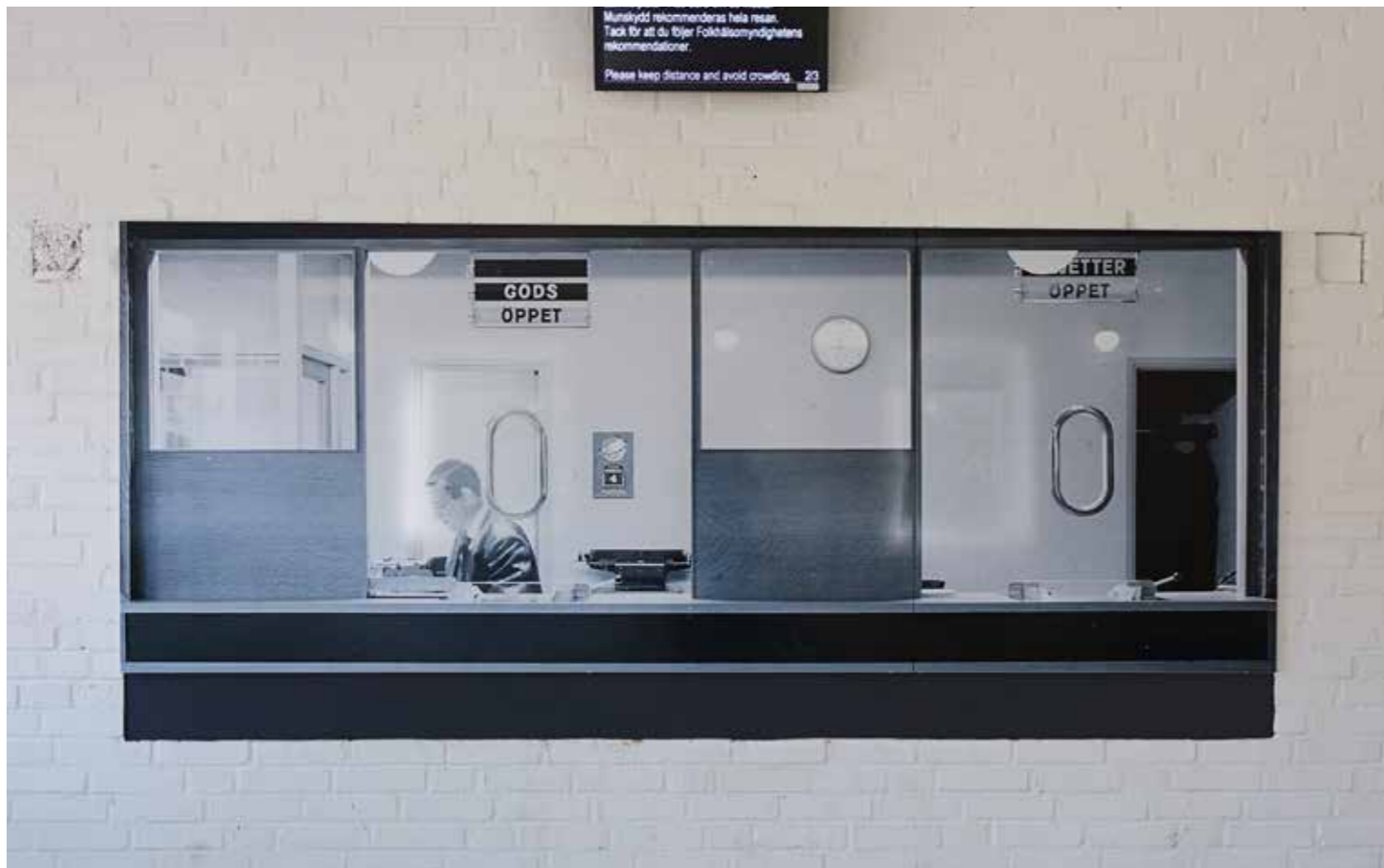
Bild Den kulturhistoriska samtidsavlans första del, installerad i Lessebo Stations väntsal, juni 2021.