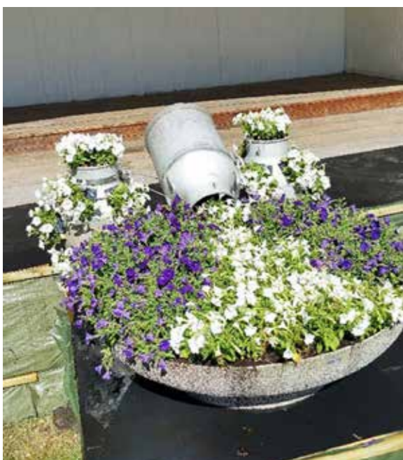
Bilder Exempel på "spilled flowers" i Lessebo.

trädgårdarbete måttligt, när föräldrarna önskade hjälp med att rensa jordgubbslandet valde Sören under flera år att inte äta jordgubbarna. Och när senare svärfar kupade potatislandet tänkte Sören att han borde planerat potatisen djupare. Vilket han gjorde själv.