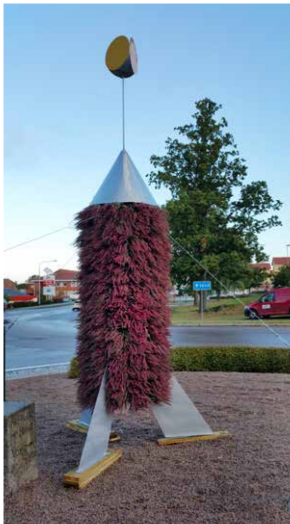
Bild Sörens rondellraket svetsad av Maik Richter.