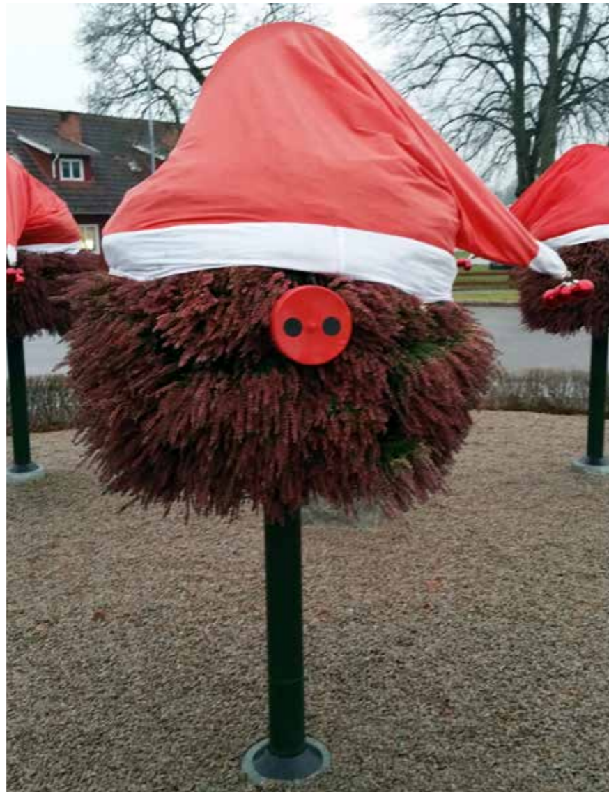
Bild Julgris skapad av återanvänt klot på stång, ljung och jättelik tomteluva.

Sören gick till biblioteket och lånade sin första bok om trädgårdsskötsel, det behövdes kunskap helt enkelt. På den tiden jobbade han på pappersbruket. Numera har han bytt jobb och har mer kunskap och en egen trädgård som för tankarna till impressionismålaren Monet, med näckrosor och en liten bro. Det är inte den enda konstreferensen i Sörens arbete, även metodmässigt finns många paralleller till samtida kulturproduktion.