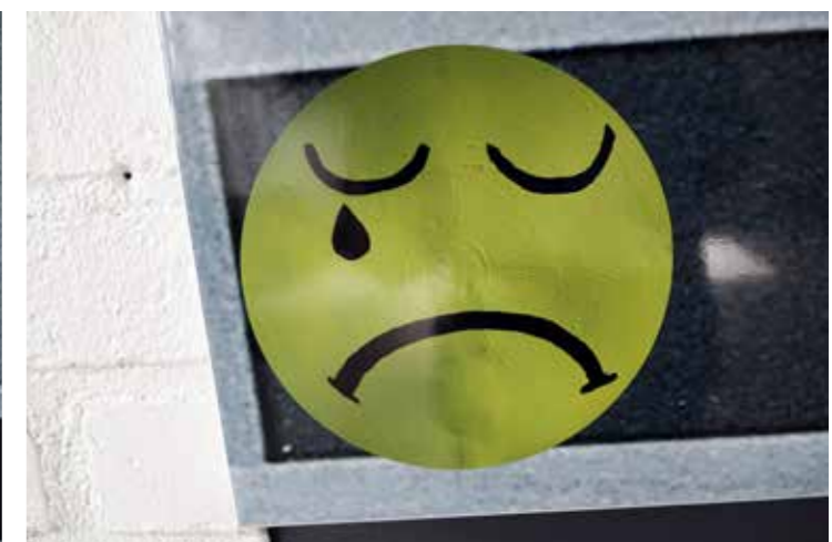
Bilder Senaste samtida tillägg gjort i september, 2021, två år efter projektets uppstart.