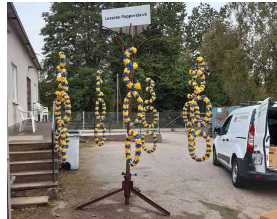
Bilder Sören Mörchs dekorationsträd med papperkransar.