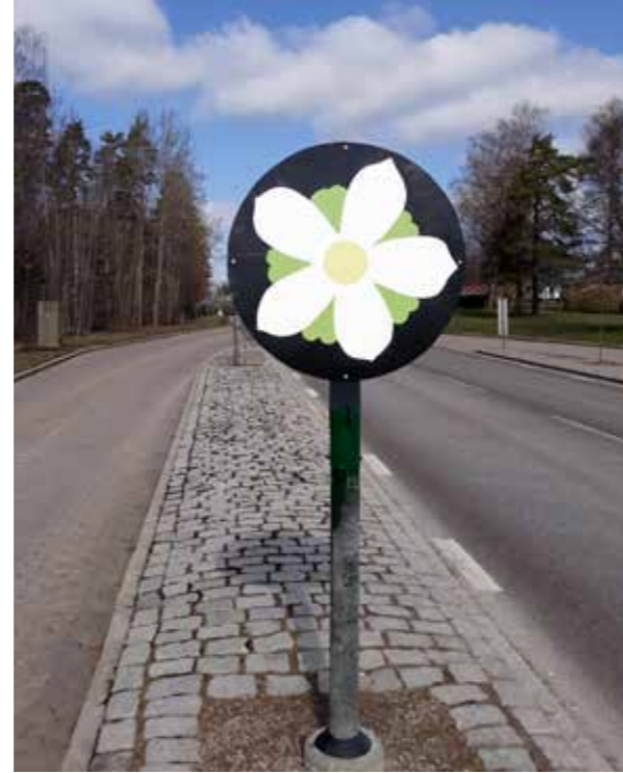
Bild "Majblomman" av högstadieeleverna på "Bikupan".

arbete som skänkt skratt, värme och mängder av selfies från Lessebo. Det är också en berättelse om skapandekraft och om att göra avtryck. Att ha en drivkraft där idéer måste materialiseras och testas.