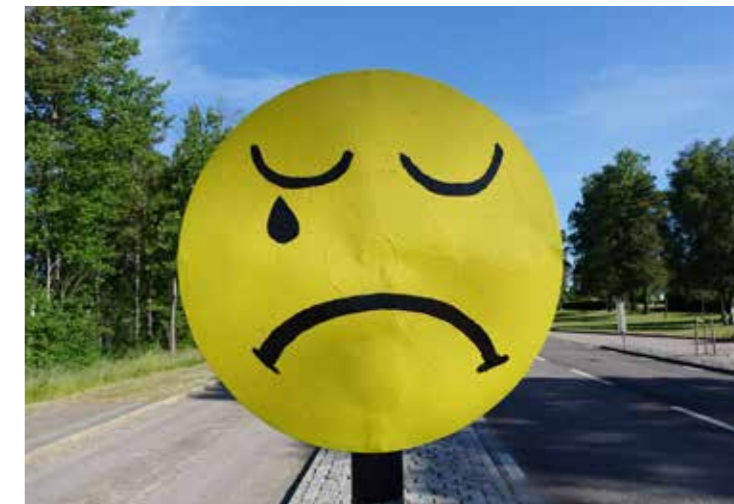
Bild Smiley-skyltar vid in- och utfart till Lessebo, målade av elever på "Bikupans" högstadieskola.