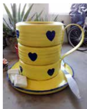
Bilder Ett urval av Sörens installationer.