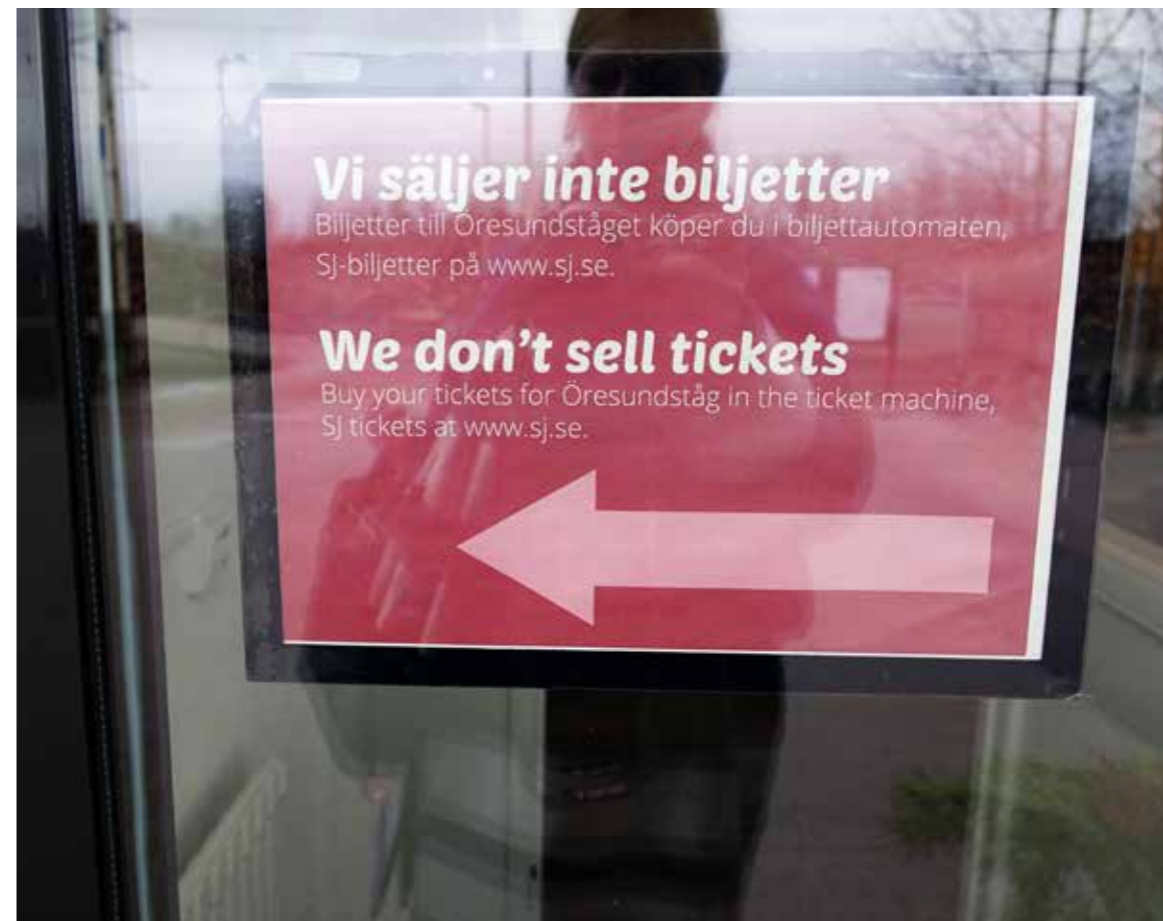
Bild Hänvisning till biljettautomat utanför väntsalen. Foto: Zandra Ahl, 2020