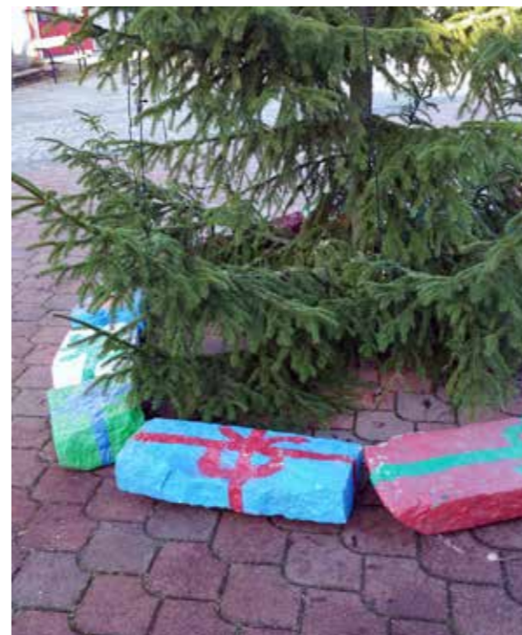
Bilder Stenar målade som julklappar.