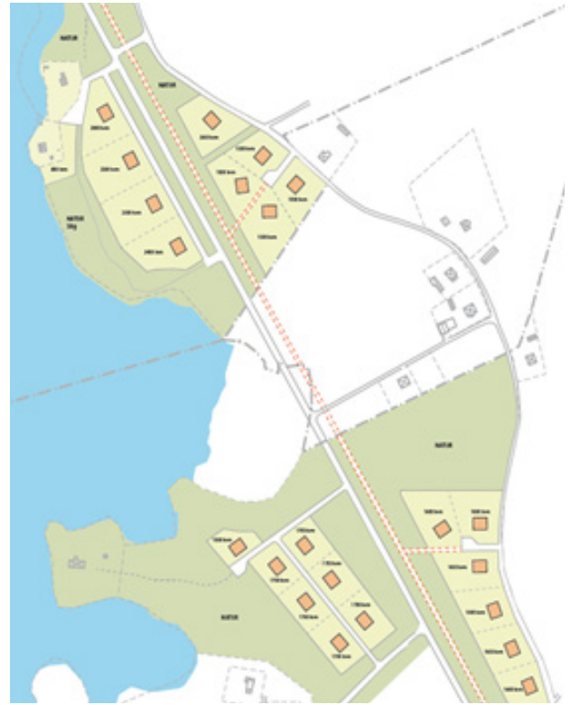
Illustration över planerade tomter i södra Hovmantorp mot Ormeshaga.

Även arbetet med att ta fram nya, attraktiva och sjönära tomter i södra Hovmantorp, mot Ormeshaga, fortsätter. Intresset är mycket stort, det är nu över 100 personer som står på vår intresselista för att köpa en av tomterna. Därför har nu antalet nya tomter utökats från 18 till 22. Försäljningen kommer till skillnad från de andra tomterna, i västra och östra Hovmantorp, att ske till marknadsmässigt pris via fastighetsmäklare. Innan försäljningen börjar kan intresseanmälan göras på vår hemsida.